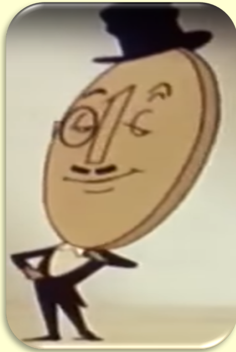
БОНУСНАЯ ФИШКА «БЮДЖЕТ»

(образ фишек взят из мультфильма «Дорогая копейка», СССР, 1961 г.)